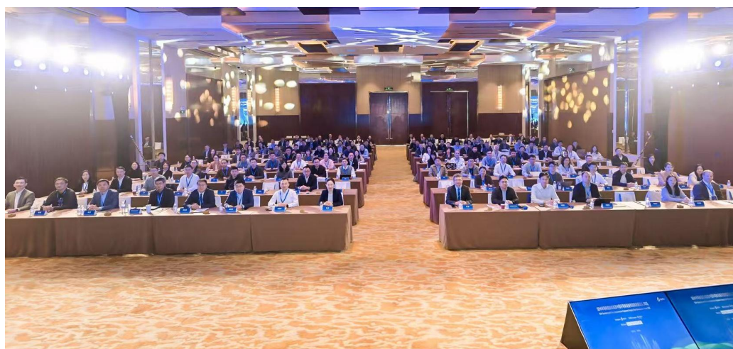
青岛-半导体供应链大会