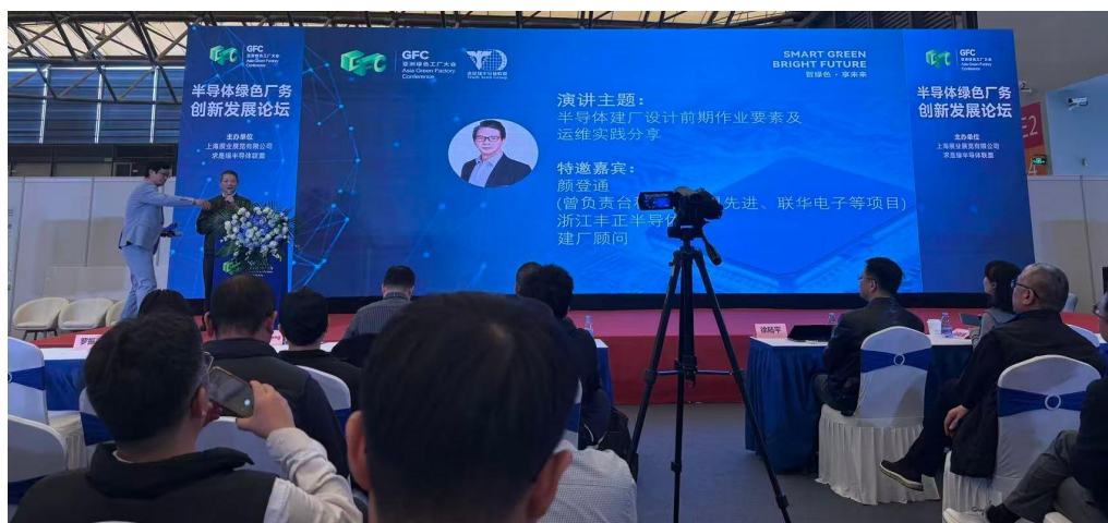
绿色场务半导体专项论坛