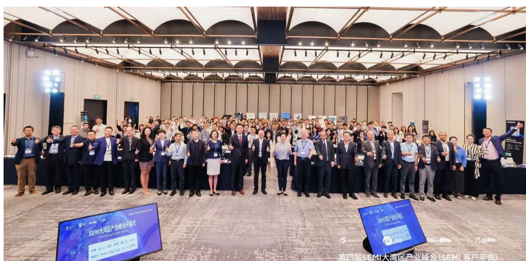
深圳大湾区产业峰会